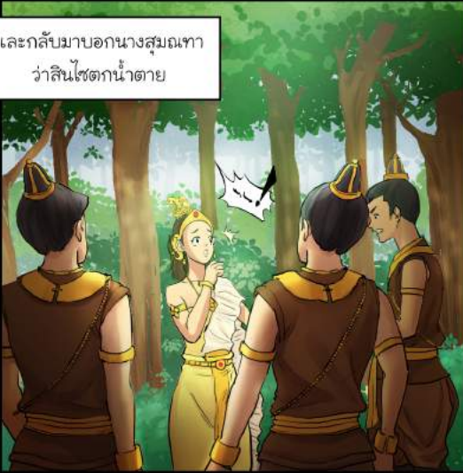
และกลับมาบอกนางสมณฑเทว่าสินไซตกน้ำตาย