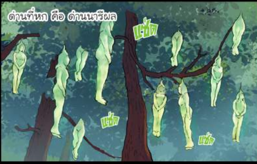
ด่านที่หก คือ ด่านนารีผล