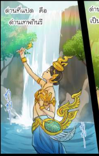
ด่านที่แปด คือ ด่านเทพกนิรี