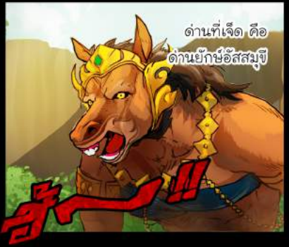
ด่านที่เจ็ด คือ ด่านยักษ์อัสสัมชี่