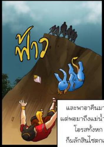
และพอาคืนมาได้ แต่พมาถึงแม่น้ำใหญ่ โอรสทั้งหก ก็वलักสินไซตกเหว