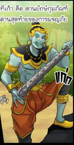
ด่านที่เก้า คือ ด่านยักษ์กุมภกัณฑ์ เป็นด่านสุดท้ายของการผจญภัย