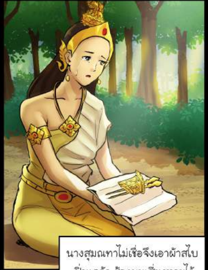
นางสมณฑเทไม่เชื่อจึงเอาผ้าสไบไปนแกล้า ซ้องผมเสี่ยงทายไว้