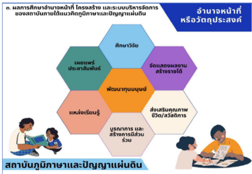
รูปที่ ๑ อำนาจและหน้าที่ของสถาบันภูมิภาษาและปัญญาแผ่นดิน

บุคลากรที่มีความรู้ความสามารถทางวิจัยและสร้างสรรค์สร้างนวัตกรรม มีฐานข้อมูลด้านประวัติศาสตร์ วิถีชีวิต และศิลปวัฒนธรรมท้องถิ่น ตลอดจนมีความคุ้นเคยกับชุมชนและประชาชนในพื้นที่ตั้งของสถานศึกษา อันเกื้อหนุนต่อการขับเคลื่อนงานตามแนวคิดภูมิภาษาและปัญญาแผ่นดิน